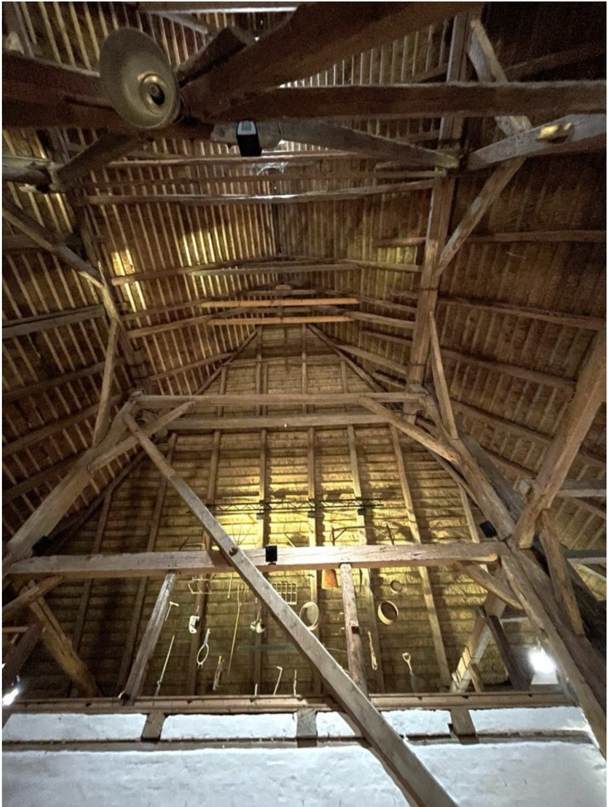
Ausgebesserter Dachstuhl eines Reetdachhauses von 1647, Roter Haubarg, Witzwort, August 2025, © Christiane Solte-Gresser