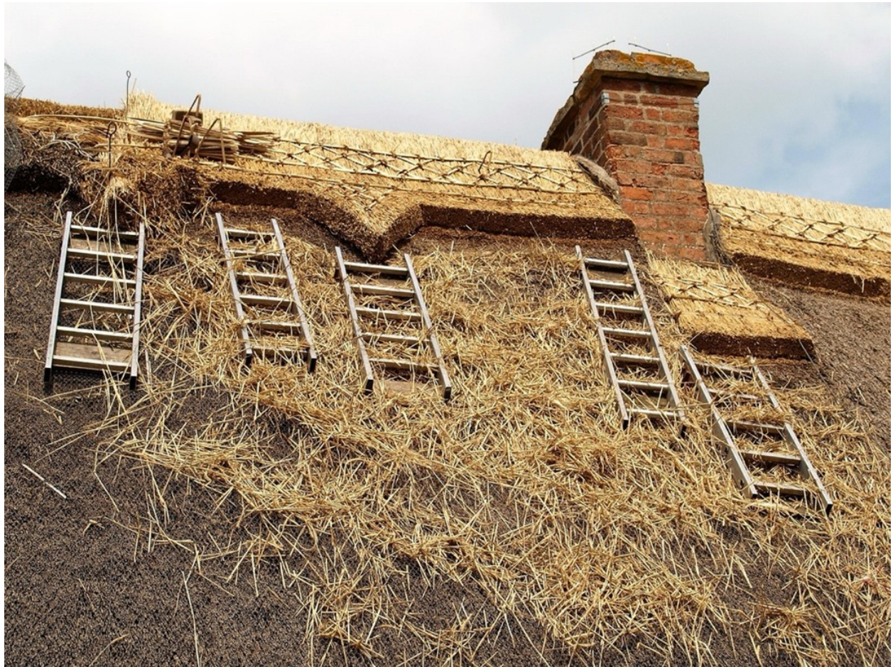
Reparatur eines alten Reetdachhauses, August 2017, © Sue Rickhuss, public domain